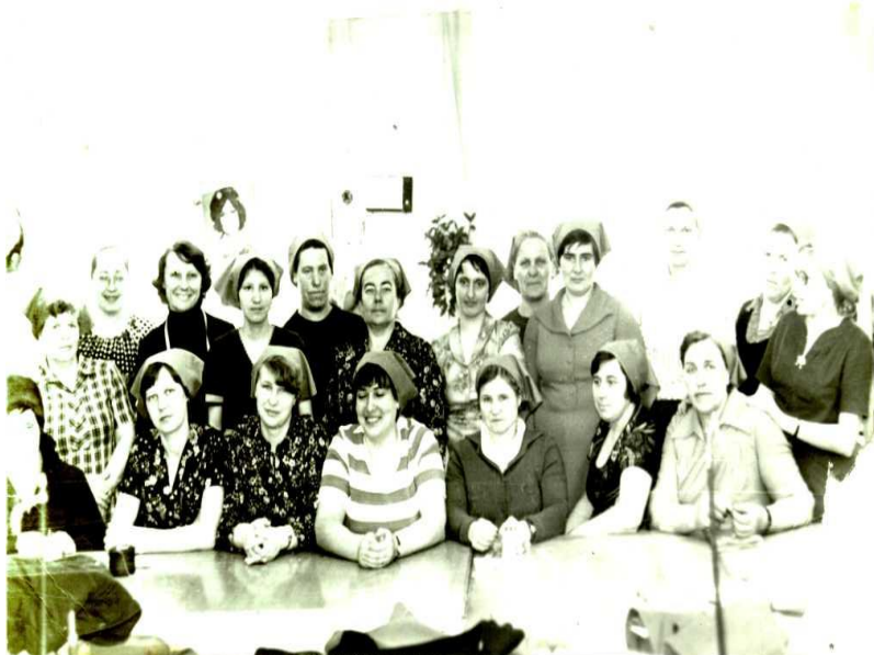
Работницы цеха, 1983 год.