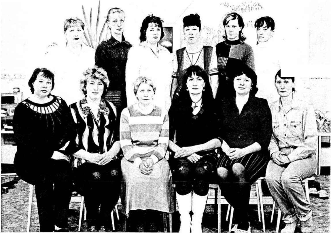
Коллектив детского сада «Ласточка»