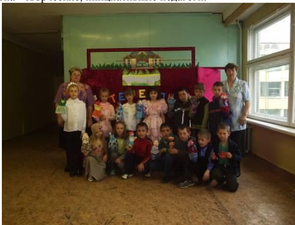
После спектакля «Теремок»